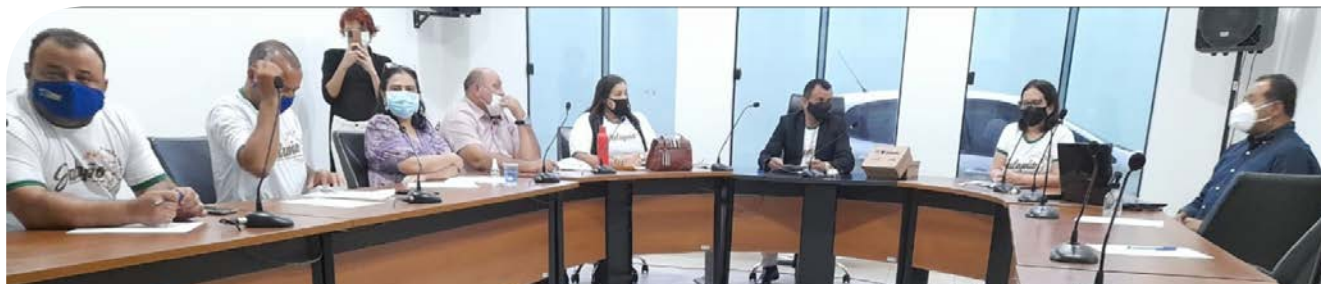
Sala de reuniões da ATM abrigou audiências e reuniões do Comurja

A união visa desenvolver e executar diversas frentes de trabalhos e serviços públicos nos Municípios consorciados, por meio de ações de governo descentralizado