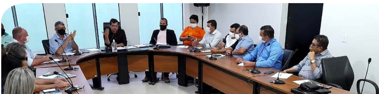
Em reunião na sede da ATM, prefeitos deliberam sobre a suspensão temporária das aulas presenciais

Cerca de 30 prefeitos do Tocantins estiveram presentes em maio deste ano, na sede da Associação Tocantinense de Municípios (ATM), em Palmas, para participarem de reunião extraordinária, convocada pela entidade municipalista, que discutiu e deliberou sobre o retorno das aulas presenciais nos Municípios. Isso porque o Governo do Estado publicou o decreto 6.257, no qual autoriza a retomada gradual das atividades educacionais, em âmbito público e privado, no estado do Tocantins.