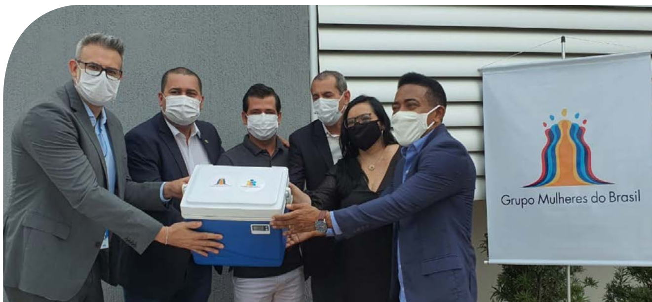
Autoridades empresariais e institucionais celebram resultados do Movimento Unidos Pela Vacina

ATM entrou no projeto em março de 2021, quando criou central de comunicação para identificar as necessidades dos Municípios ao processo de vacinação contra a COVID-19