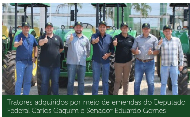
Tratores adquiridos por meio de emendas do Deputado Federal Carlos Gaguim e Senador Eduardo Gomes

desenvolvimento e oportunidade nos municípios. Só quem está na administração municipal sabe a necessidade e a falta que um utilitário desses faz. O senador Eduardo Gomes e eu estamos trabalhando para conquistar recursos e suprir essas necessidades dos nossos municípios", destacou. (com informações da SECOM/TO)