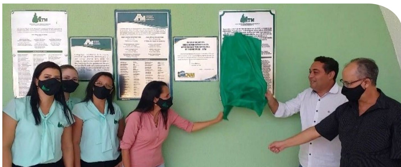
Sistema Solar Fotovoltaico foi inaugurado com a presença de prefeitos e colaboradores da ATM

O uso da energia solar fotovoltaica cresceu no Brasil 14,4% neste primeiro trimestre de 2020, quando comparado ao mesmo período de 2019, aponta a Associação Brasileira de Energia Solar Fotovoltaica (ABSOLAR).