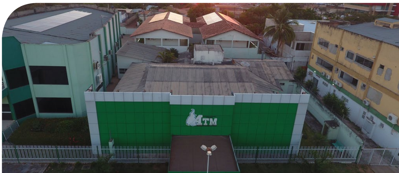
Placas instaladas no auditório Manuel de Paula Bueno e Hotel ATM